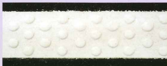
レインフラッシュラインスーパー (白)