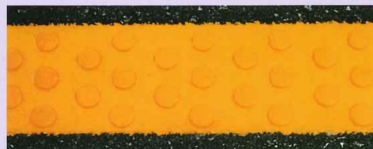
レインフラッシュラインスーパー 鉛・クロムフリー黄