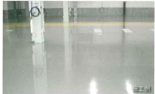
塗装色は指定色グレー

※日塗工色見本には無いため色見本を掲載します。 ※この色見本は印刷物のため実際の色調とは多少異なります。 標準色の指定・選定・ご注文は必ず別冊の標準カラーサンプルをお願いします。