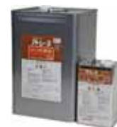
14kgセット アトレーヌ UトップG