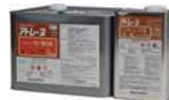
4.2kgセット アトレーヌ UトップG