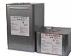
18kgセット アトレーヌ U-#60スーパーN