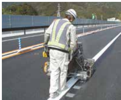
施 工 中