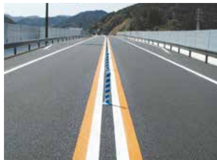
施 工 前