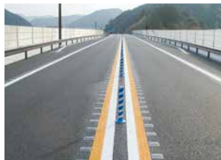
施 工 後