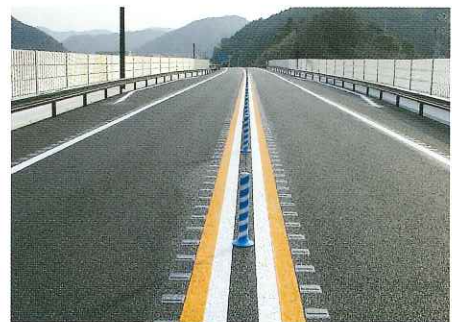
施 工 後