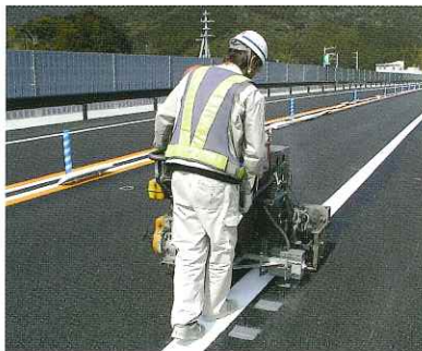
施 工 中