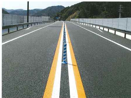
施 工 前