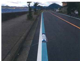
サイクリングロード