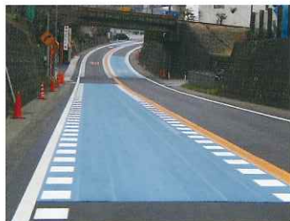
カーブ進入危険防止