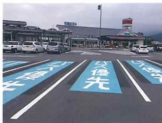
バス優先駐車スペース