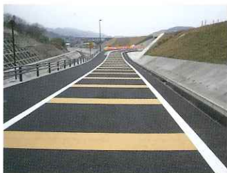
カーブ進入危険防止