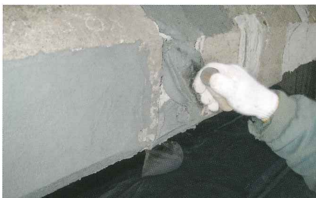
③断面修復材による充填