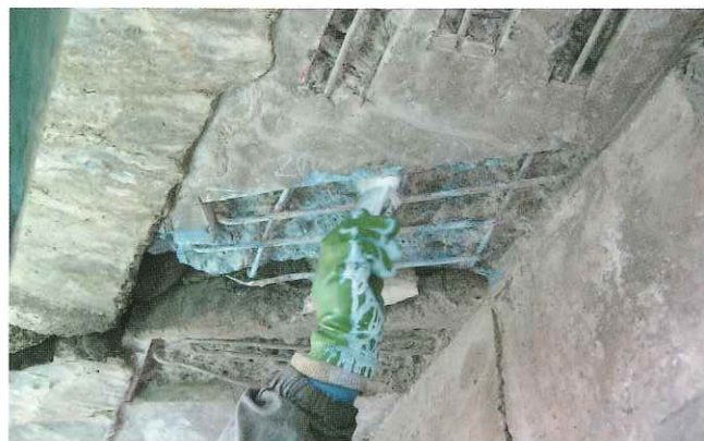
②プライマーの塗布