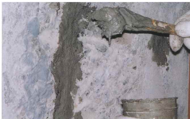
①鉄筋防錆材の塗布