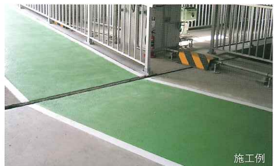
塗装色は#11グリーン