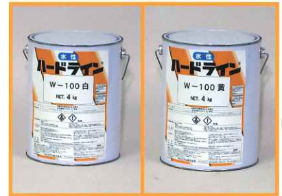
ライン引き用塗料 水性ハードラインW-100 白・黄